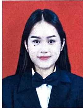
Gambar 1. Foto dengan background warna merah